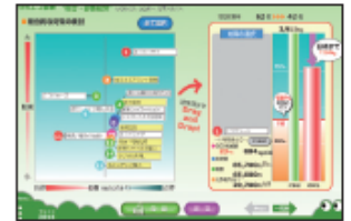
効果的な対策のご提案